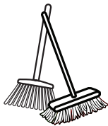
BROOM OR PUSH BROOM